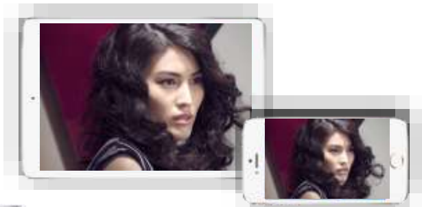
移动端开机广告 前贴片广告(捆绑何以相关视频&爱情类电影)