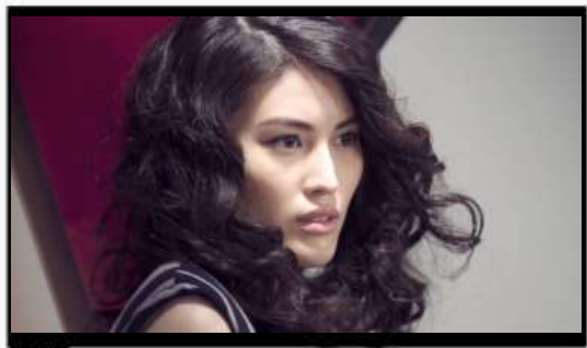
TV屏乐视超级电视开机广告

在乐视生态布局的五屏上实现全平台、全时间、全触点，覆盖全部目标人群，实现最佳的传播效果