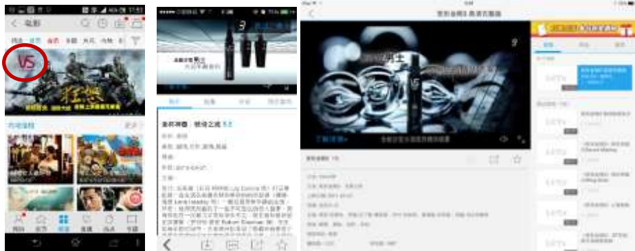
【Phone端+ iPad端】电影频道定向贴片+电影频道焦点图logo露出