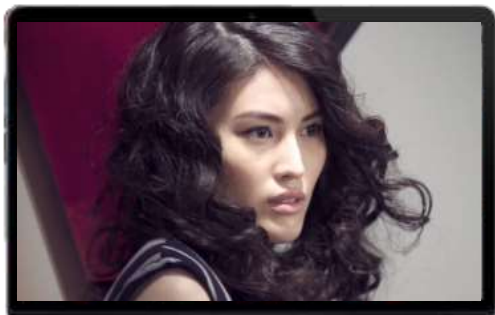
PC屏首页富媒体 前贴片广告(捆绑何以相关视频&爱情类电影)