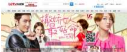
——首页电影栏目logo露出——